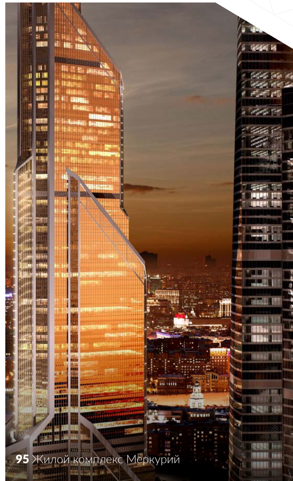
95 Жилой комплекс Меркурий