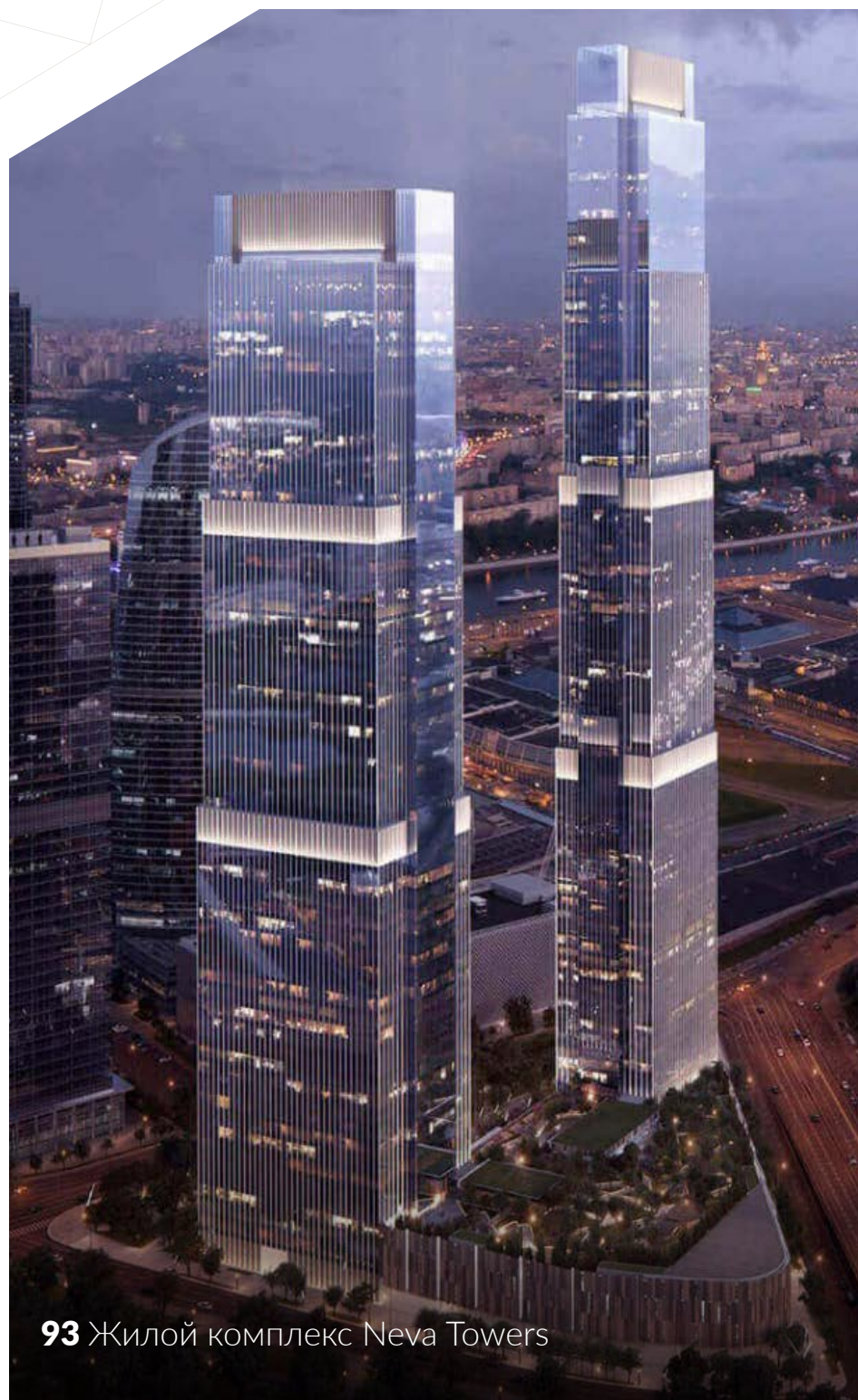
93 Жилой комплекс Neva Towers

Приемка квартиры, дизайн-проект, отделка, сдача в аренду, зачет и продажа недвижимости.