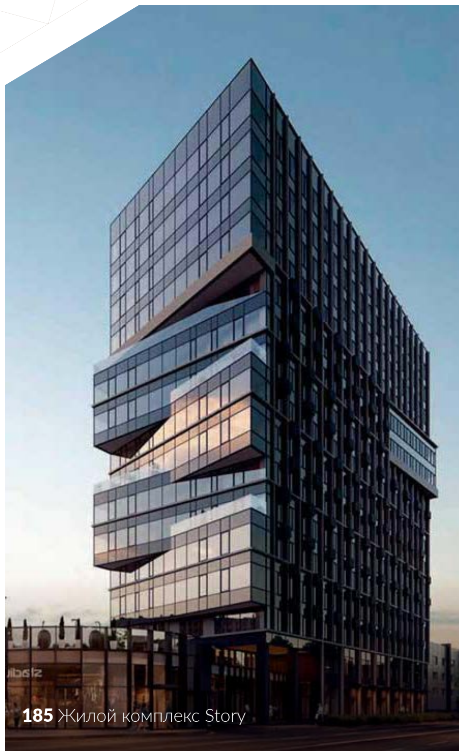
185 Жилой комплекс Story